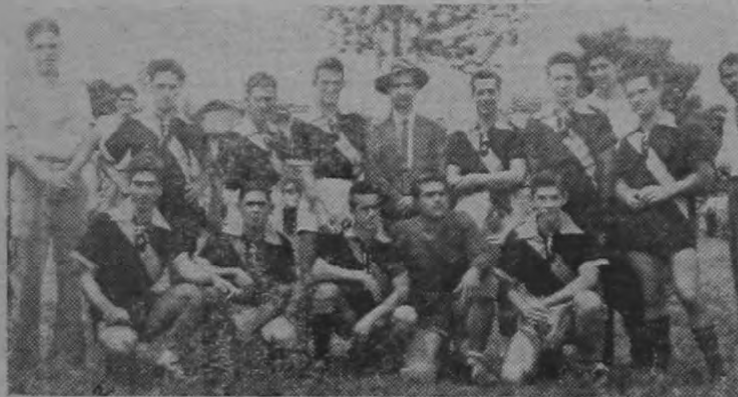
Equipo de Sarchi que obtuvo la victoria en reñido encuentro con el equipo de "LA REPUBLICA", aparece aquí acompañando a don José Figueres, el caudillo de la democracia, en cuyo homenaje se concertó la competencia.