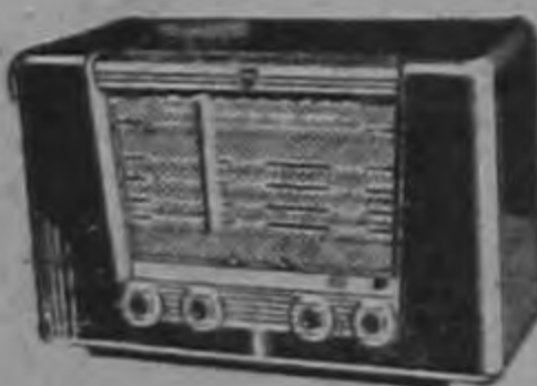
Bx 505 AV

Los receptores Philips son los receptores acertados. Se han conquistado un renombre mundial de seguridad, y estos aparatos harán honor a la gran marca que llevan.