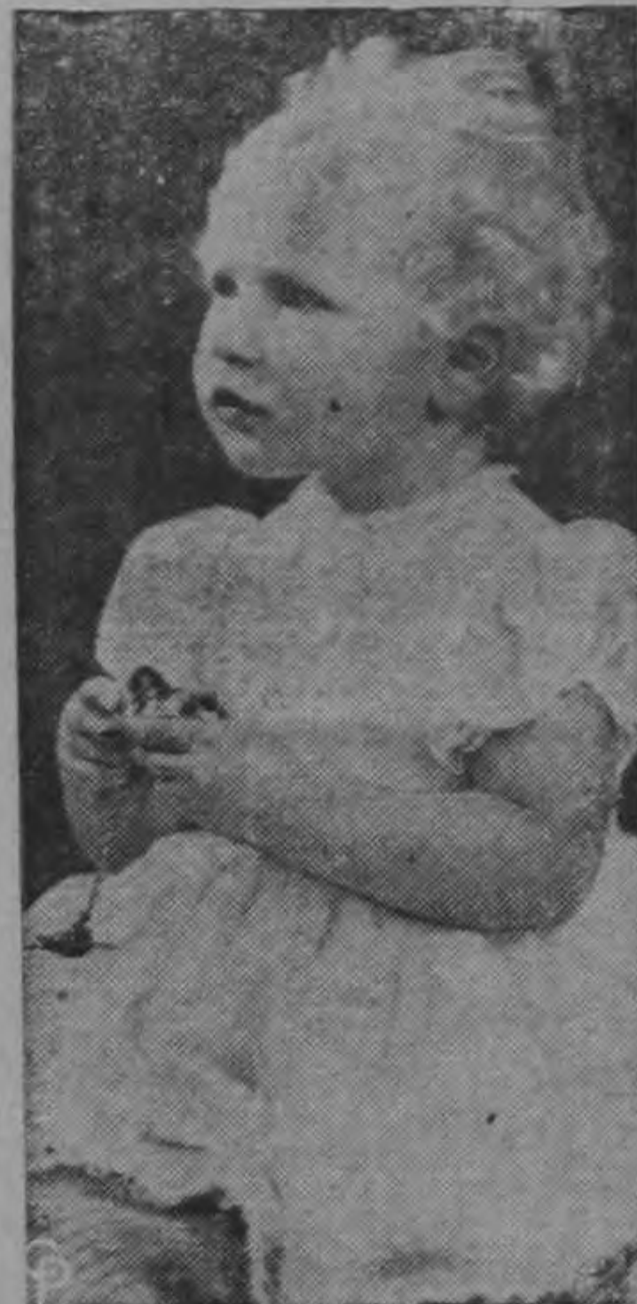
Una foto excelente de la Princesa Ana, segunda hija de Isabel II, de Inglaterra. La niña tiene en la mano un reloj de cristal, con el cual también se retratará su madre a la misma edad y por el mismo fotógrafo: Marcos Adams.