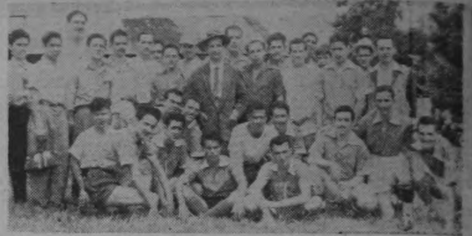
Integrantes del cuadro de futbol de "LA REPUBLICA" rodeado por don José Figueres, antes del interesante partido que jugaron en Sarchi de Valverde Vega, en honor del ilustre hombre público.