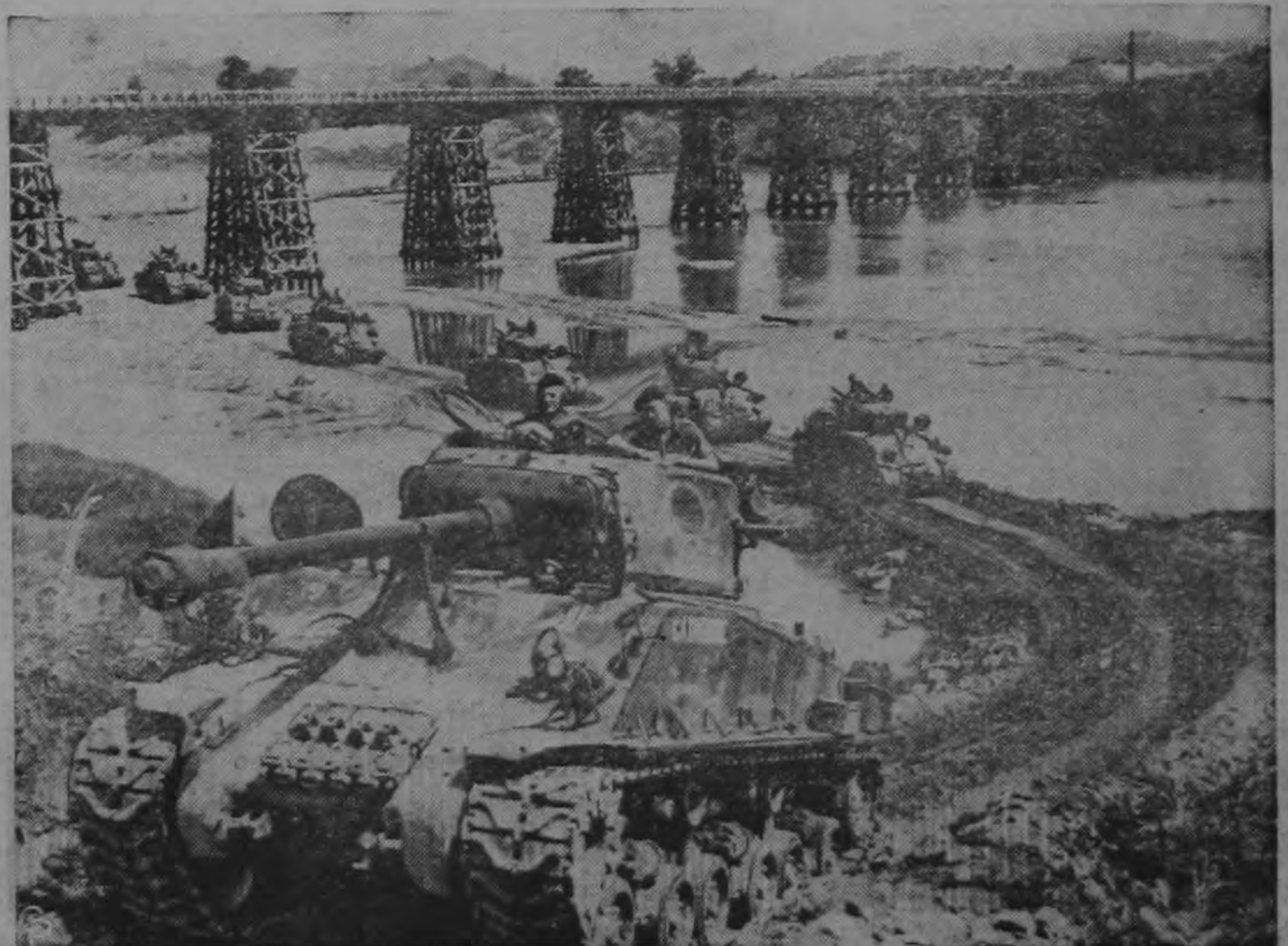
Tanques canadienses rodeando un cerro en Corea, después de haber cruzado un imponente puente metálico construido por la ingeniería aliada.